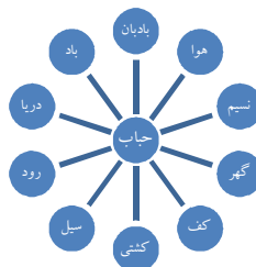
نمودار 1- حباب دو عنصری